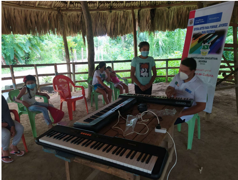
Proyecto de música (piano)