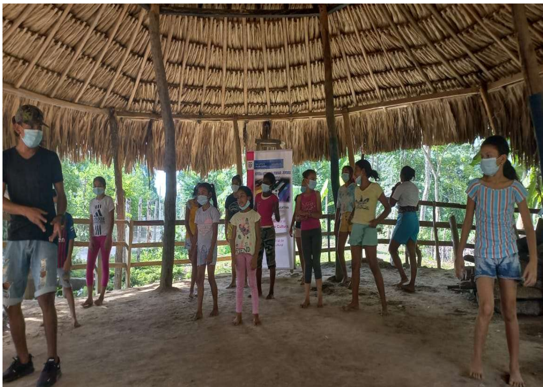
Proyecto de danza