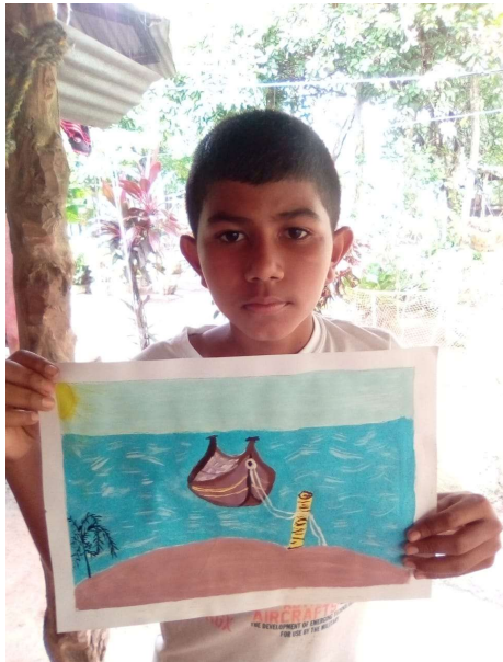
Proyecto de pintura apoyo CONFACOR