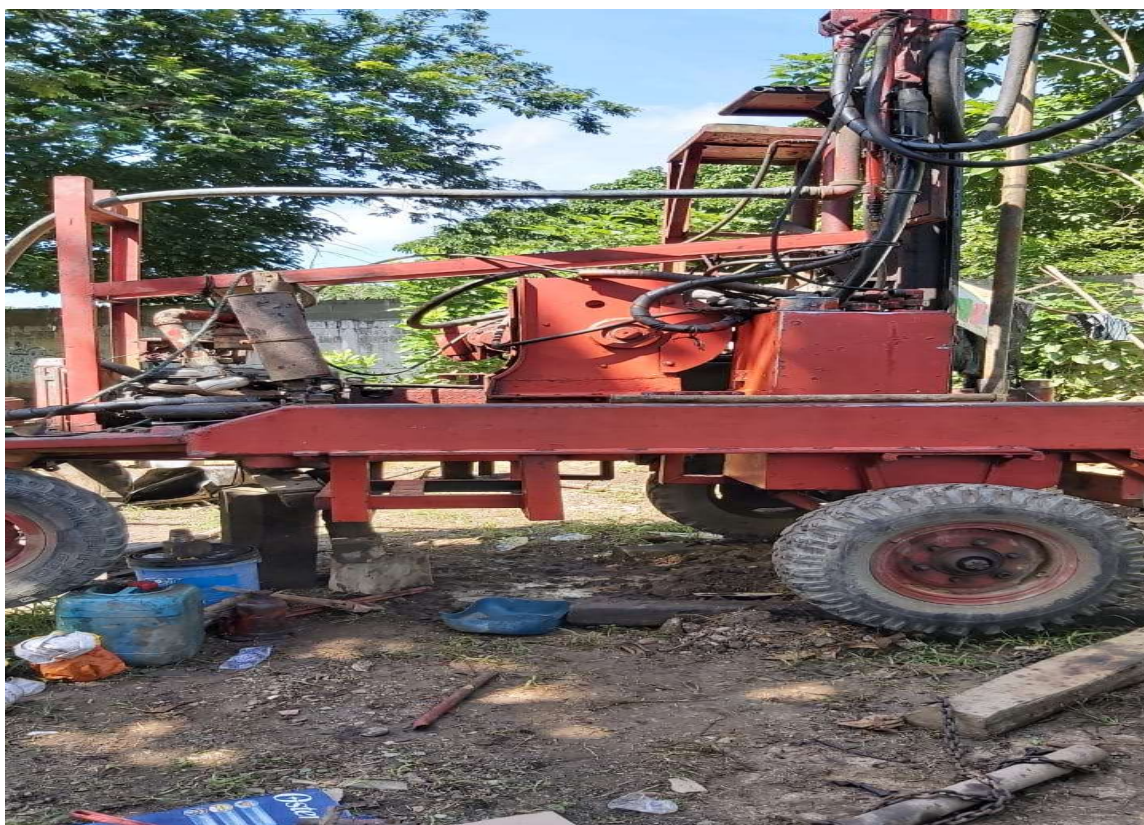
Maquina desarrollando la perforación pozo subterráneo

La alcaldía construyó un pozo subterráneo para el servicio de agua que facilitó el desarrollo de los protocolos de bioseguridad.