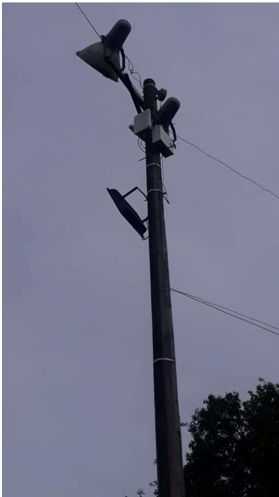
Equipos para puntos wifi gratis