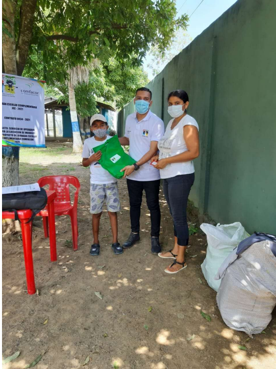
Proyecto de pintura apoyo CONFACOR