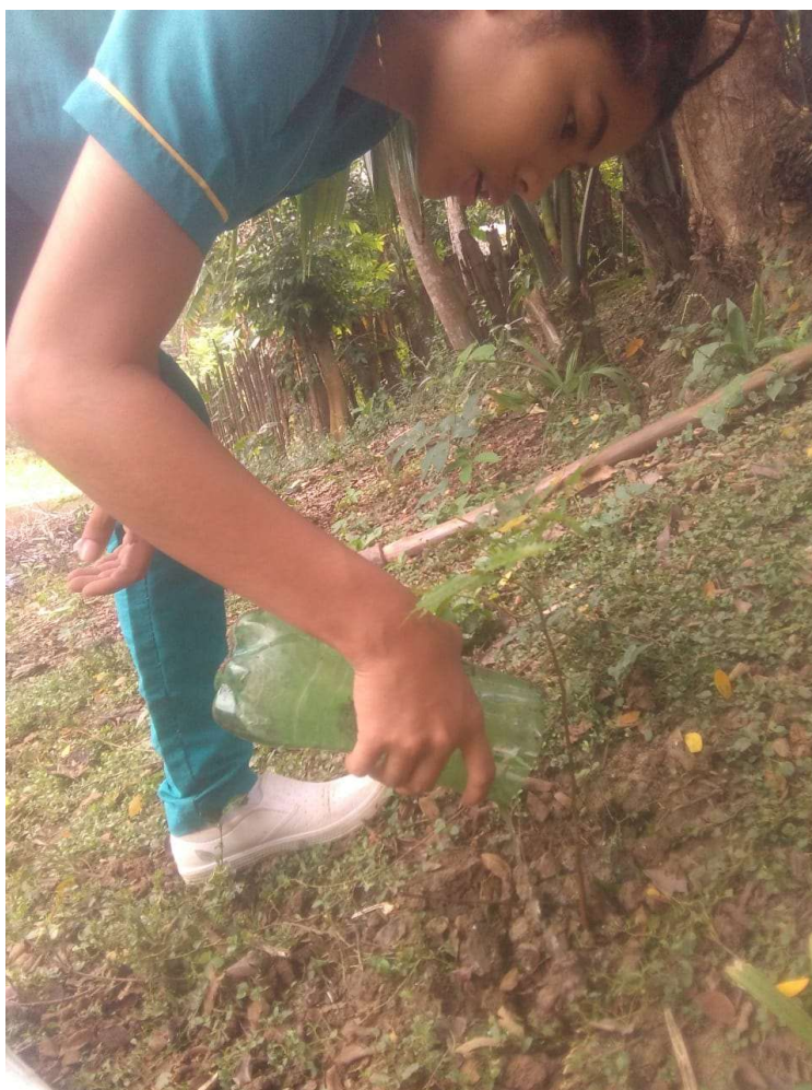
Proyectos de jornada única