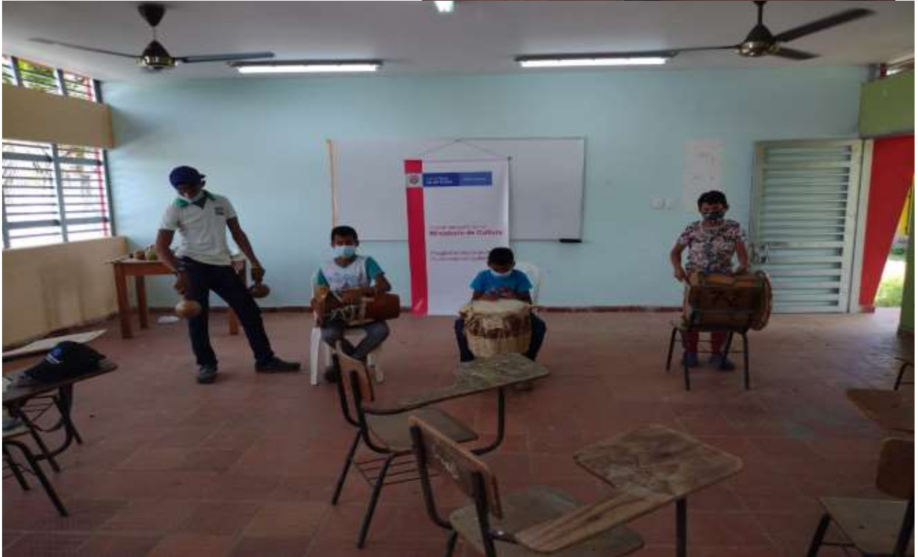
Taller de prácticas de pitos, tambores y maracas