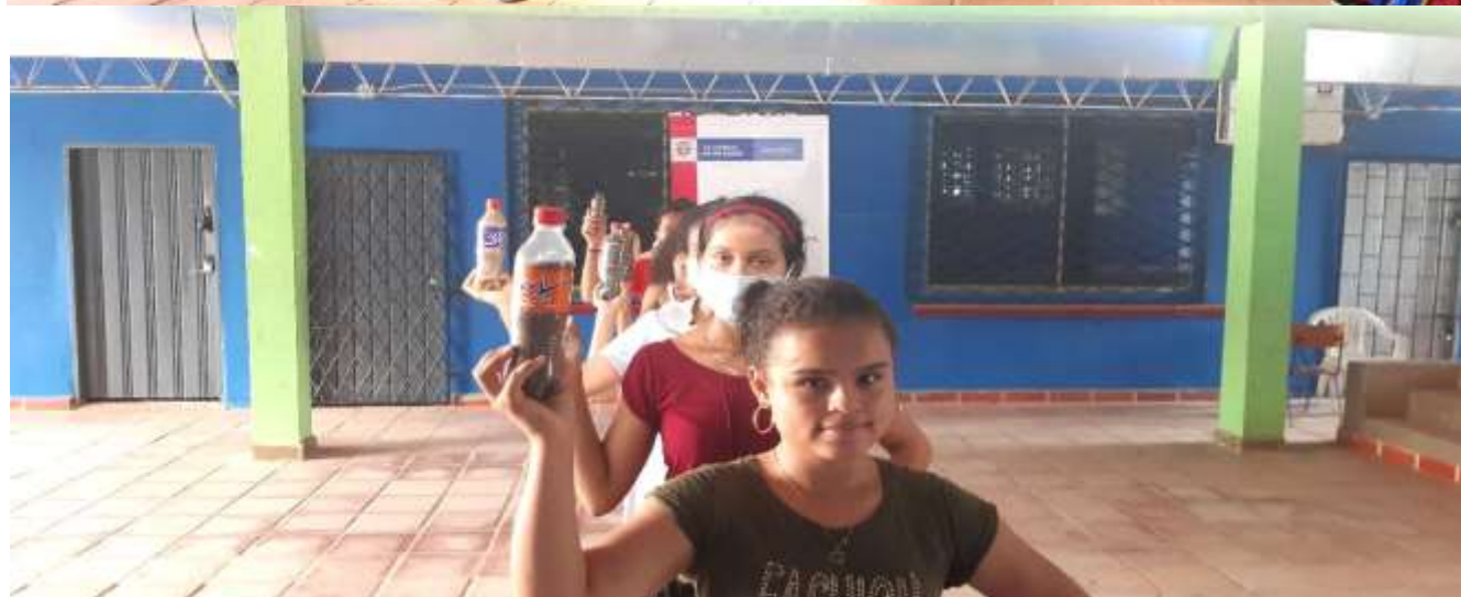
Sesión de prácticas de bailes tradicionales.