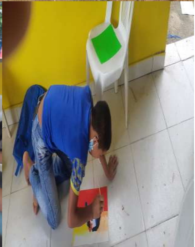
Talleres de Pintura