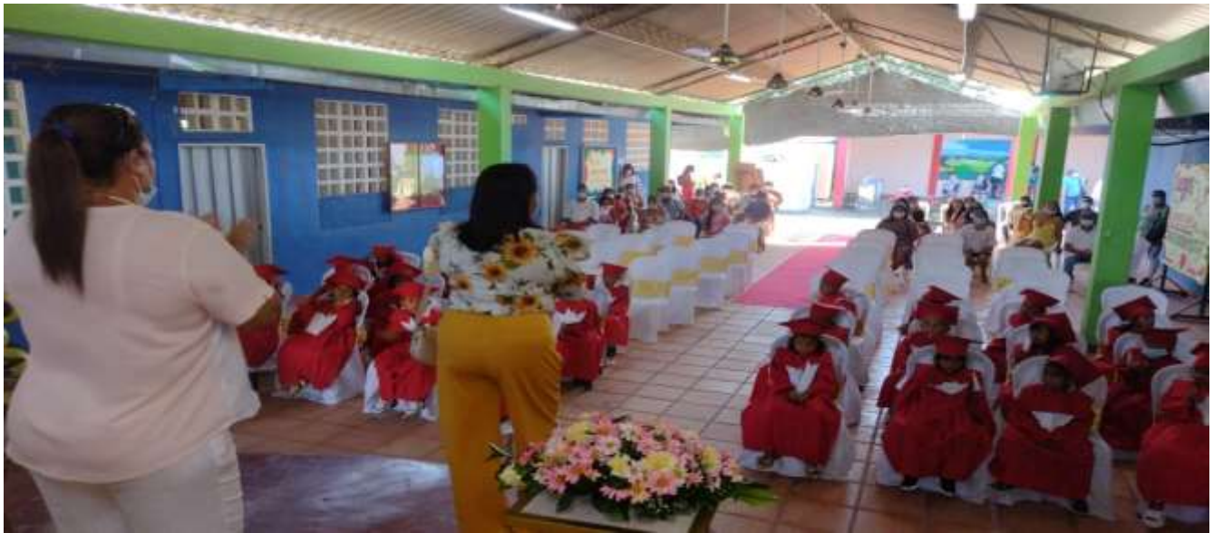
Estudiantes de preescolar –Graduación 2021