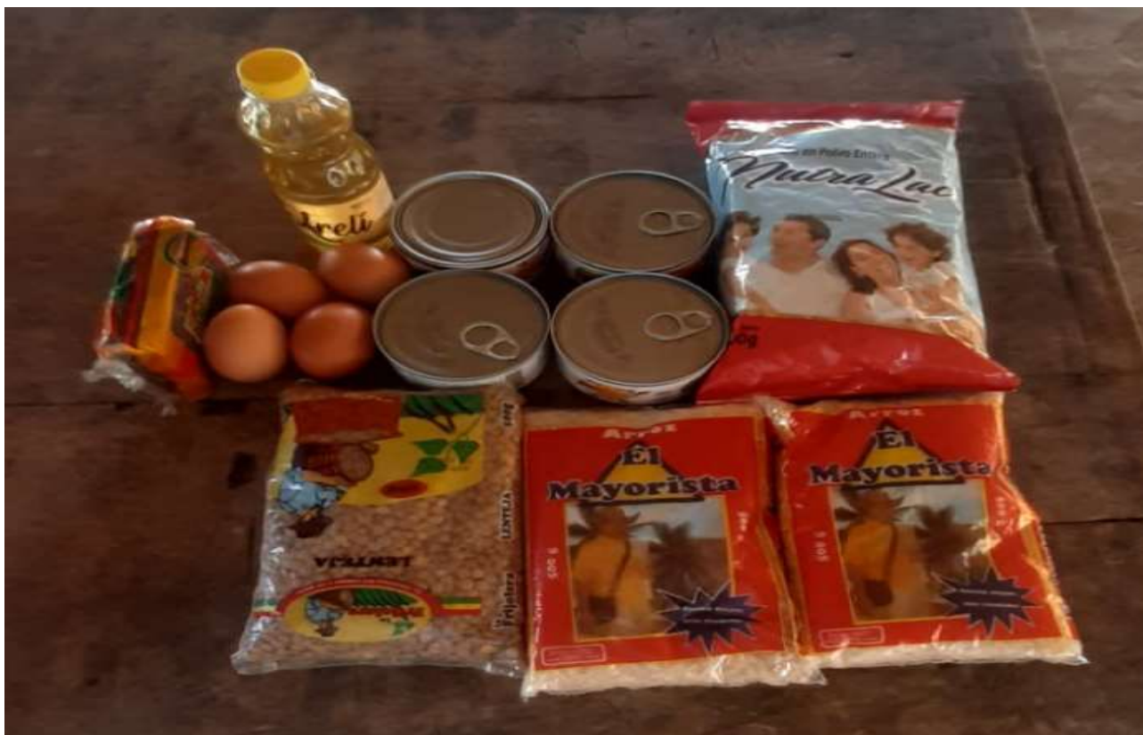
Paquetes de alimentos entregados a los estudiantes por la gobernación PAE

Sin duda lo que le entregaban a los estudiantes dejaba mucho que desear por la escasa cantidad de alimentos recibidos y que se hacía cada dos meses.