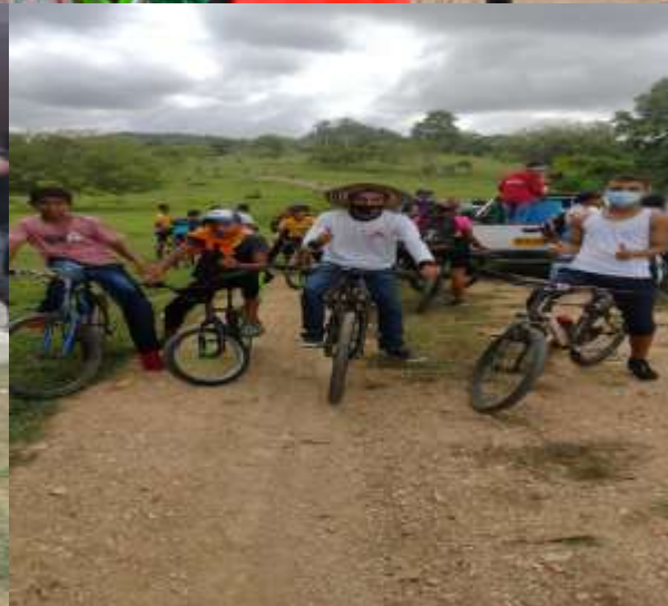
Se realizó un bicipaseo por las veredas aledañas de la institución con participación de la comunidad educativa con varios descansos para hidratación.