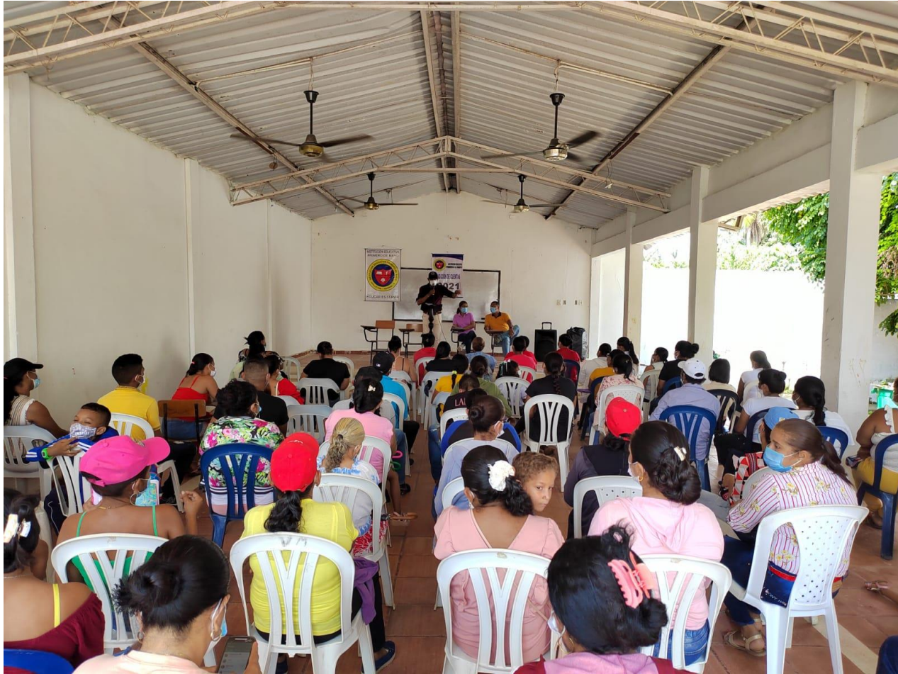
PADRES DE FAMILIA EN REUNION DE SOCIALIZACION RENDICION DE CUENTAS 2021.