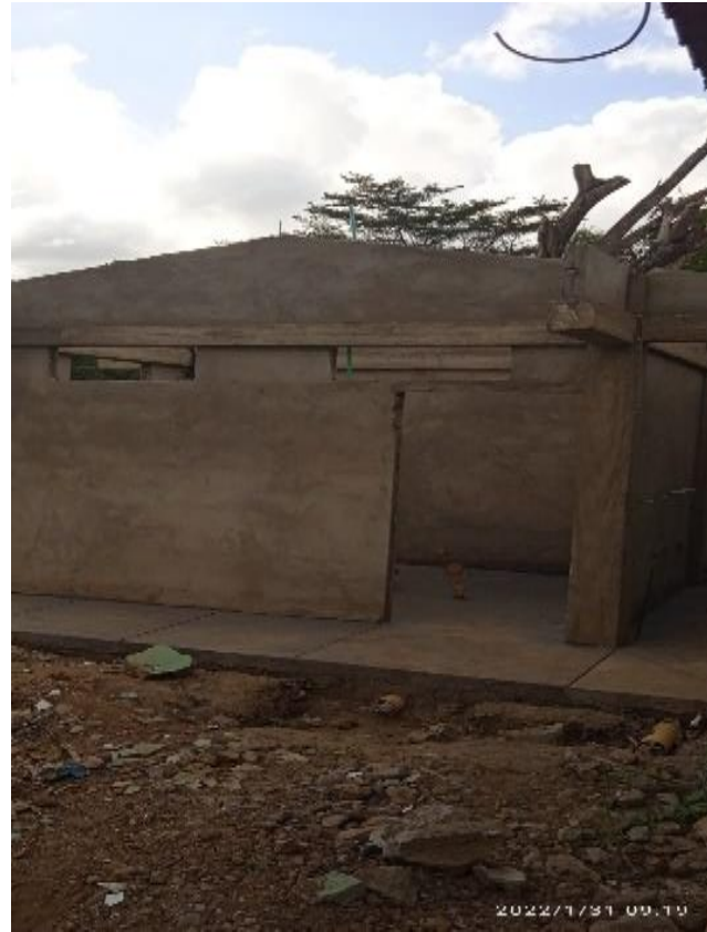
CONSTRUCCION DE BATERIAS DE BAÑO, FFIE 2021