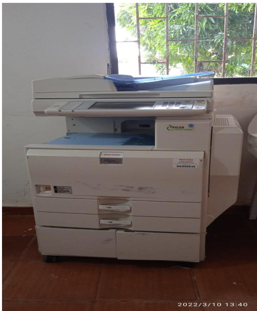
EQUIPOS DE FOTOCOPIADORA, PARA ENFRETAR LA EDUCACION REMOTA POR MEDIO DE GUIAS 2021