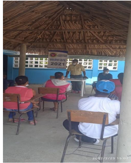
SOCIALIZACION RENDICION DE CUENTAS COUNIDASD CAMELLON CALLEJAS 2021.