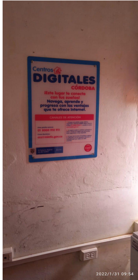
EQUIPO DE INTERNET SATELITAL MINTIC, CLARO 2021