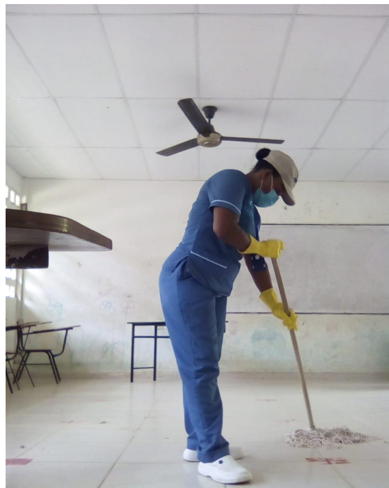
SERVICIO DE ASEO SUMINISTRADO POR LAL GOBERNACION JULIO A DICIEMBRE 2021.