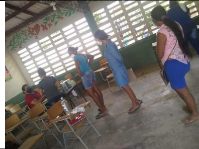
RECEPCION GUIA # 1 Y ENTREGA DE GUIAS # 2, junio 30