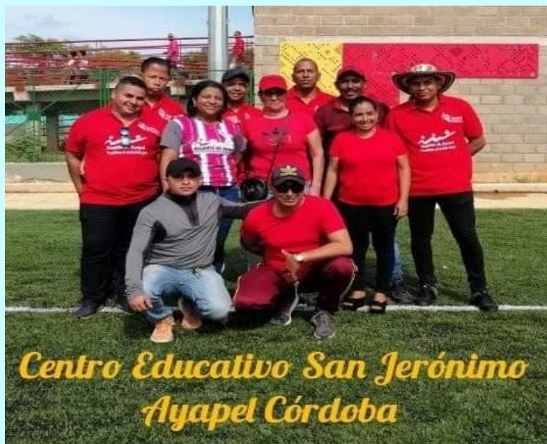
Centro Educativo San Jerónimo Ayapel Córdoba