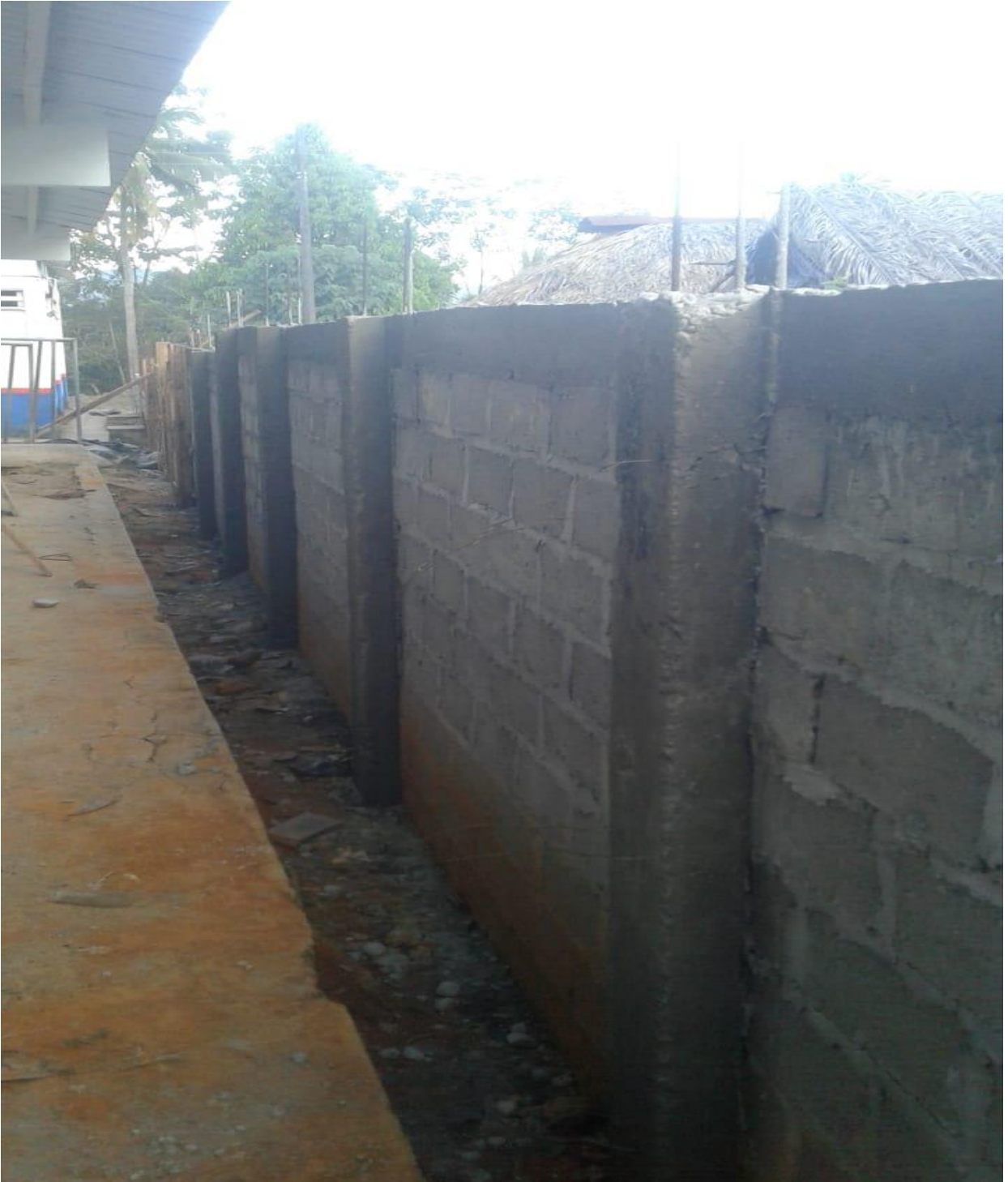
CONSTRUCCION DE MURO SEDE PRINCIPAL