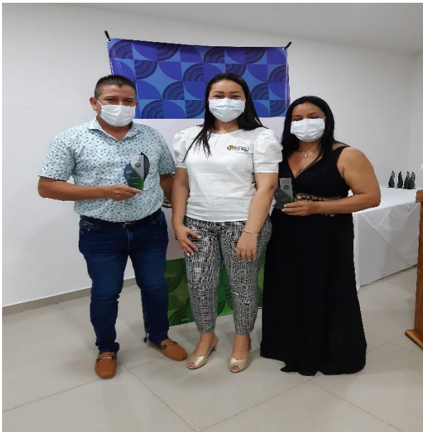
Premiación noche de los mejores de la Educación en Córdoba