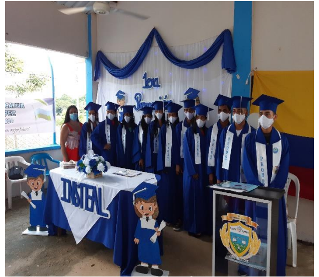
Primera promoción de bachilleres 2020