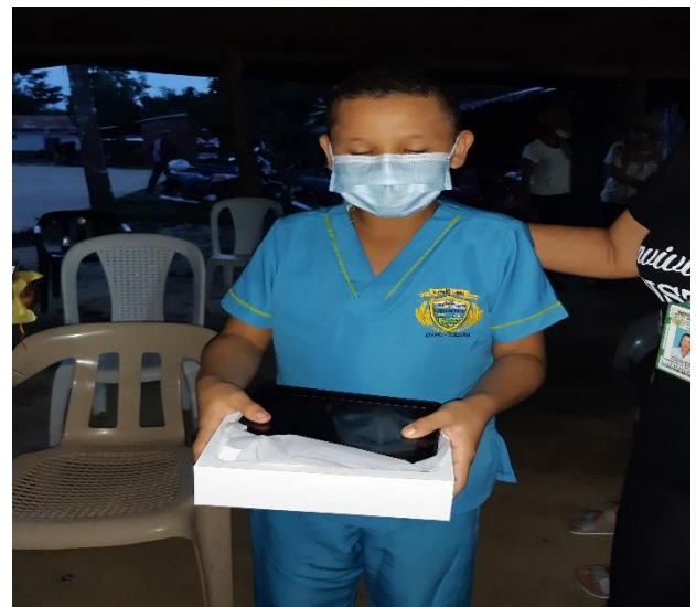
Entrega de premios ganadores primer concurso de cuentos escolares 2020