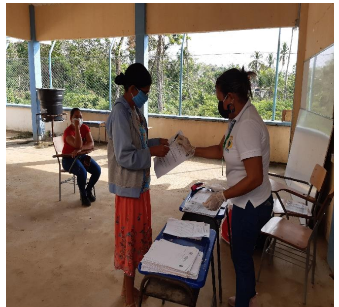
Entrega de guías de estudio en casa a padres de familias