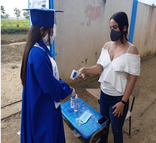
Implementación protocolos de bioseguridad

Con reconocimiento oficial de la secretaría de educación del departamento de Córdoba, mediante Resolución N° 4221 de 21 de octubre de 2019, última actualización, que ampara los grados de preescolar, Básica primaria, básica secundaria (6º, 7º, 8º y 9º) y Media grado 10º y 11º).