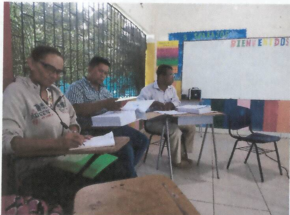
Rector y docentes dando informes del recurso económico.

A 9 Km en la Vía que conduce de Planeta Rica a la Vereda La Fortuna Email: ee_223555210501@hotmail.com – Celular: 3162958904 Vereda La Fortuna, Municipio de Planeta Rica.