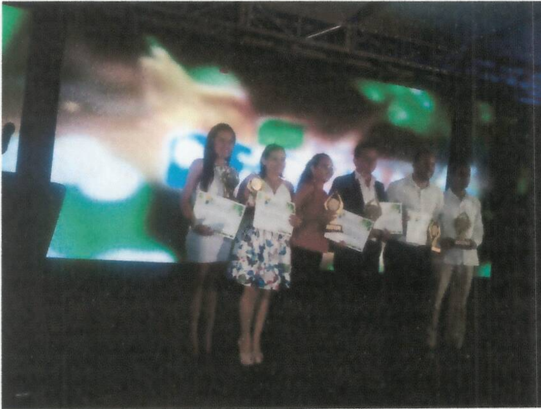
Entrega del premio gemas en barranquilla año 2017

DANE: 223555002105 - NIT: 812004787-1 REGISTRO DEL CÓDIGO PEI No.250-495 de 2015