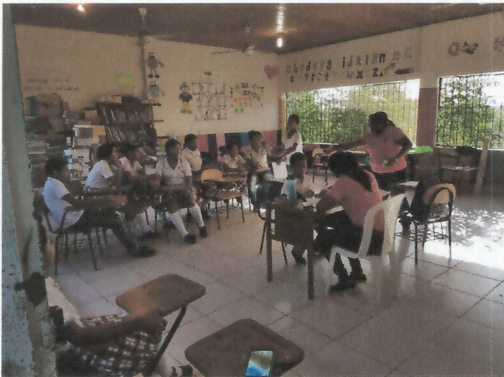
Brigada de salud hospital san Nicolás 2017

A 9 Km en la Vía que conduce de Planeta Rica a la Vereda La Fortuna Email: ee_223555210501@hotmail.com – Celular: 3162958904 Vereda La Fortuna, Municipio de Planeta Rica.