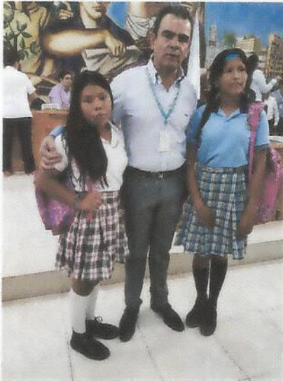
Contralora estudiantil 2017 en montería.

Con reconocimiento oficial según la Resolución No. 002288 de Septiembre 25 de 2015, Para los Niveles de Preescolar y Básica, Emanada de la Secretaría de Educación Departamental. DANE: 223555002105 - NIT: 812004787-1 REGISTRO DEL CÓDIGO PEI No. de 2015