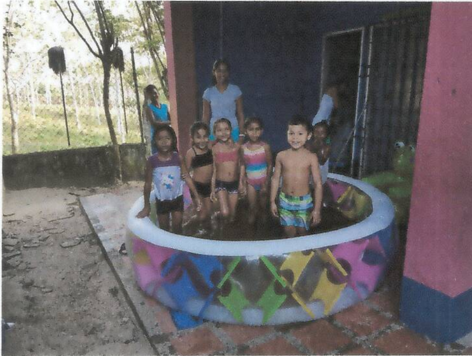
Piscinas en la institución año 2017

Con reconocimiento oficial según la Resolución No. 002288 de Septiembre 25 de 2015, Para los Niveles de Preescolar y Básica, Emanada de la Secretaría de Educación Departamental. DANE: 223555002105 - NIT: 812004787-1 REGISTRO DEL CÓDIGO PEI No. de 2015