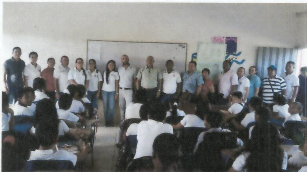
El personero - el secretario de educación municipal y los docentes. recurso humano de la institución.

A 9 Km en la Vía que conduce de Planeta Rica a la Vereda La Fortuna Email: ee_223555210501@hotmail.com – Celular: 3162958904 Vereda La Fortuna, Municipio de Planeta Rica.