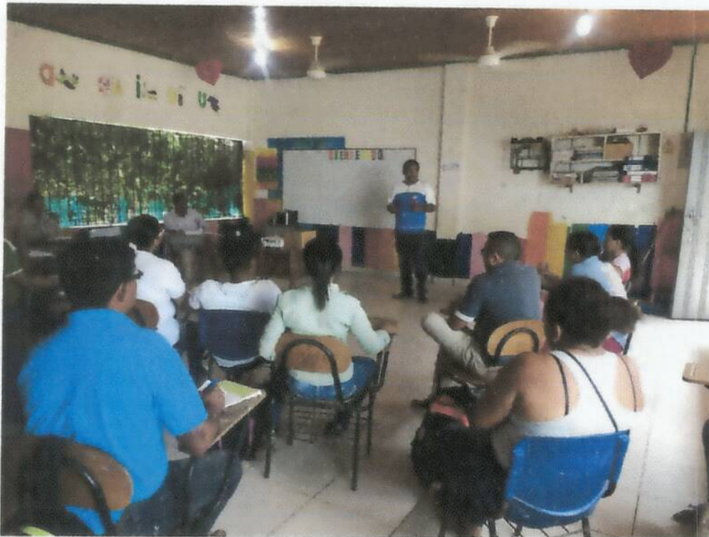
Docentes dando a conocer aspectos relacionados con el desempeño académico Año 2017.

Con reconocimiento oficial según la Resolución No. 002288 de Septiembre 25 de 2015, Para los Niveles de Preescolar y Básica, Emanada de la Secretaría de Educación Departamental. DANE: 223555002105 - NIT: 812004787-1 REGISTRO DEL CÓDIGO PEI No. de 2015