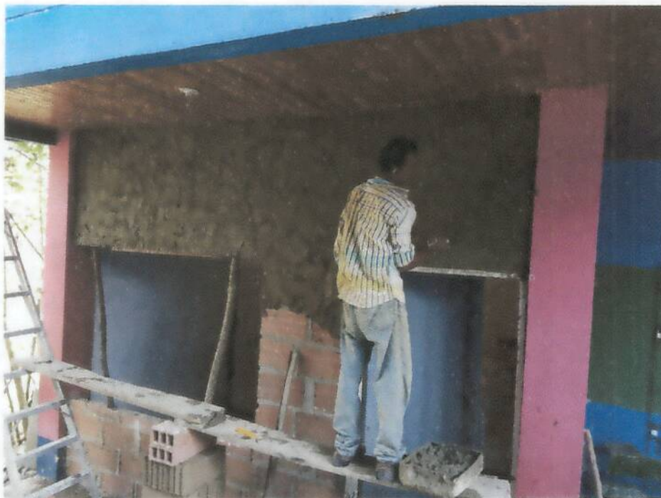
Evidencias de trabajos de mantenimiento año 2017

DANE: 223555002105 - NIT: 812004787-1 REGISTRO DEL CÓDIGO PEI No. de 2015