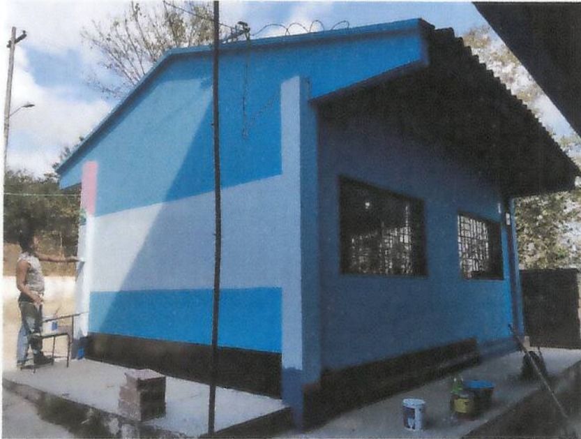
Pintada de la sede principal año 2017

Con reconocimiento oficial según la Resolución No. 002288 de Septiembre 25 de 2015, Para los Niveles de Preescolar y Básica, Emanada de la Secretaría de Educación Departamental. DANE: 223555002105 - NIT: 812004787-1 REGISTRO DEL CÓDIGO PEI No. de 2015