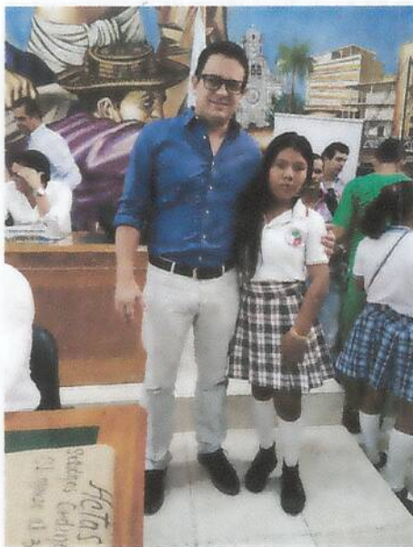
Contralora estudiantil 2017

A 9 Km en la Vía que conduce de Planeta Rica a la Vereda La Fortuna Email: ee_223555210501@hotmail.com – Celular: 3162958904 Vereda La Fortuna, Municipio de Planeta Rica.