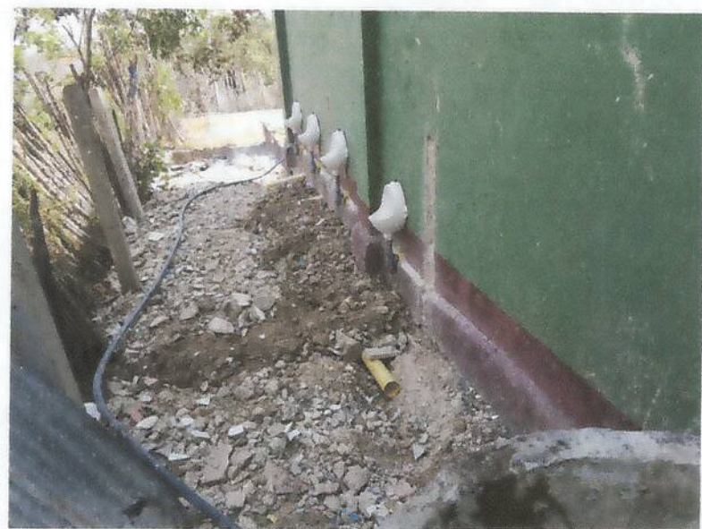
Trabajos de mantenimiento eléctrico y redes sanitarias año 2017

Con reconocimiento oficial según la Resolución No. 002288 de Septiembre 25 de 2015, Para los Niveles de Preescolar y Básica, Emanada de la Secretaría de Educación Departamental. DANE: 223555002105 - NIT: 812004787-1 REGISTRO DEL CÓDIGO PEI No. de 2015