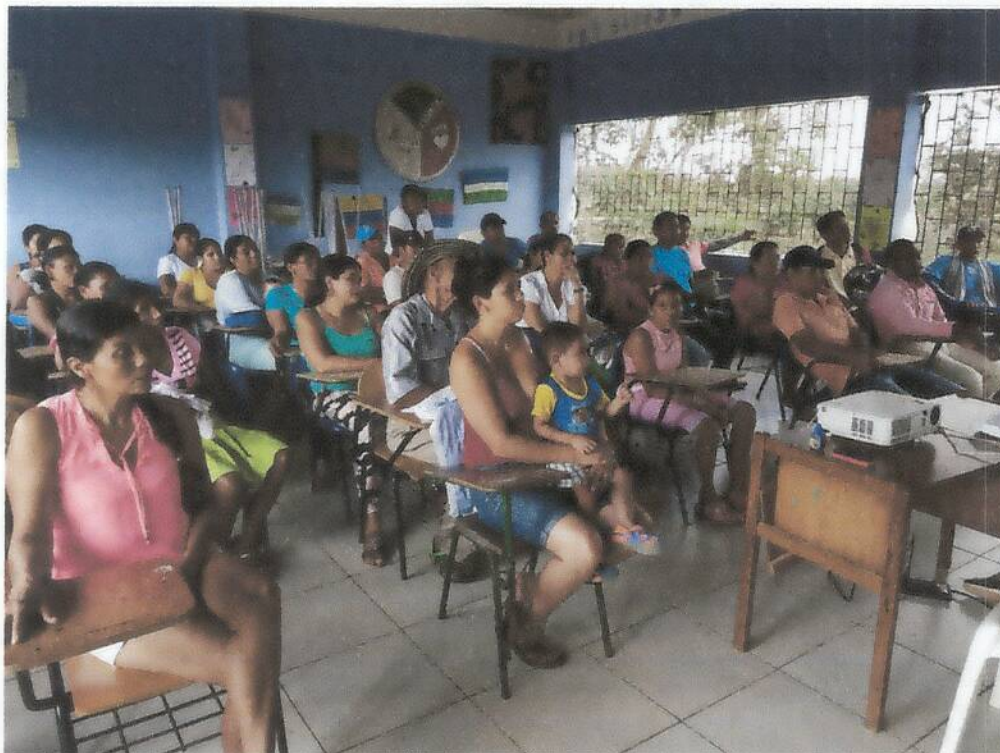
La comunidad participa de la rendición de cuentas año 2017

Con reconocimiento oficial según la Resolución No. 002288 de Septiembre 25 de 2015, Para los Niveles de Preescolar y Básica, Emanada de la Secretaría de Educación Departamental. DANE: 223555002105 - NIT: 812004787-1 REGISTRO DEL CÓDIGO PEI No. de 2015