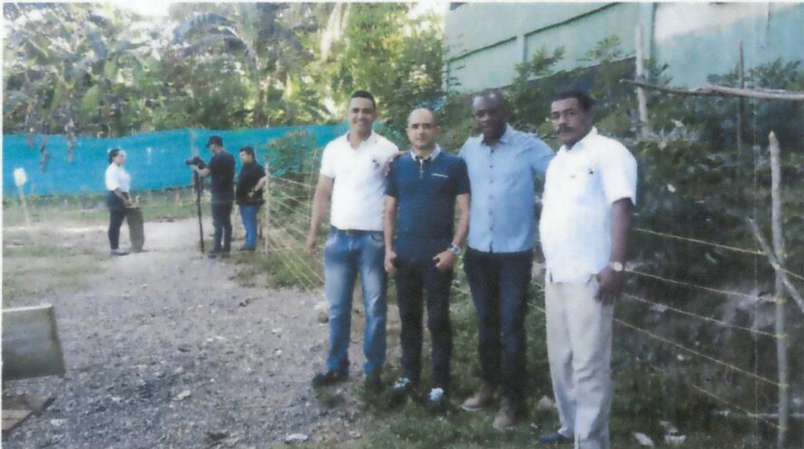
Jurados del concurso gemas y docentes de la institución año 2017

Con reconocimiento oficial según la Resolución No. 00565 de Septiembre 20 de 2012, Para los Niveles de Preescolar y Básica, Emanada de la Secretaría de Educación Departamental. DANE: 223555002105 - NIT: 812004787-1 REGISTRO DEL CÓDIGO PEI No.250-495 de 2015