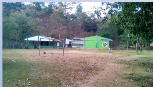
SEDE FRANCISCO PAULA SANTANDER