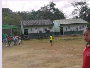
SEDE SAN JOSÉ DE FABRA