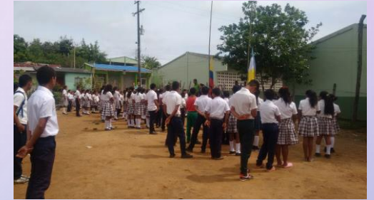
SEDE SANTO DOMINGO