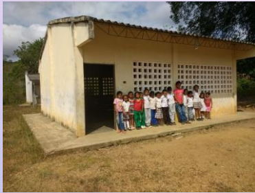
SEDE PIRÚ ARRIBA