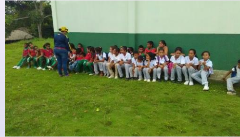
SEDE POLICARPA SALAVARRIETA