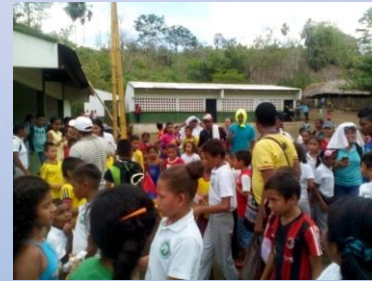
SEDE COCUELO LIMÓN