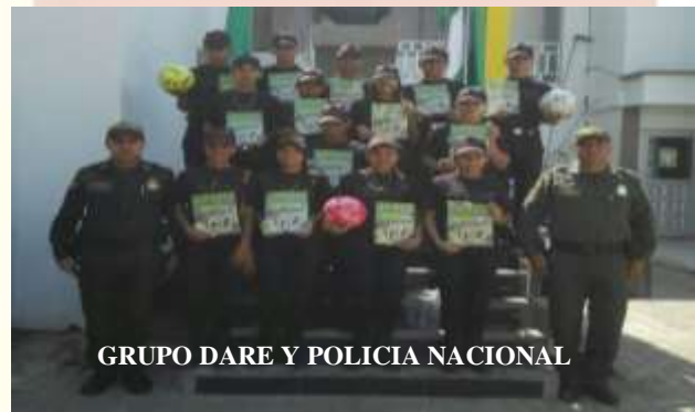
GRUPO DARE Y POLICIA NACIONAL