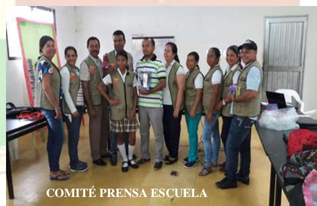
COMITÉ PRENSA ESCUELA