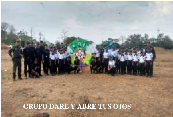
GRUPO DARE Y ABRE TUS OJOS