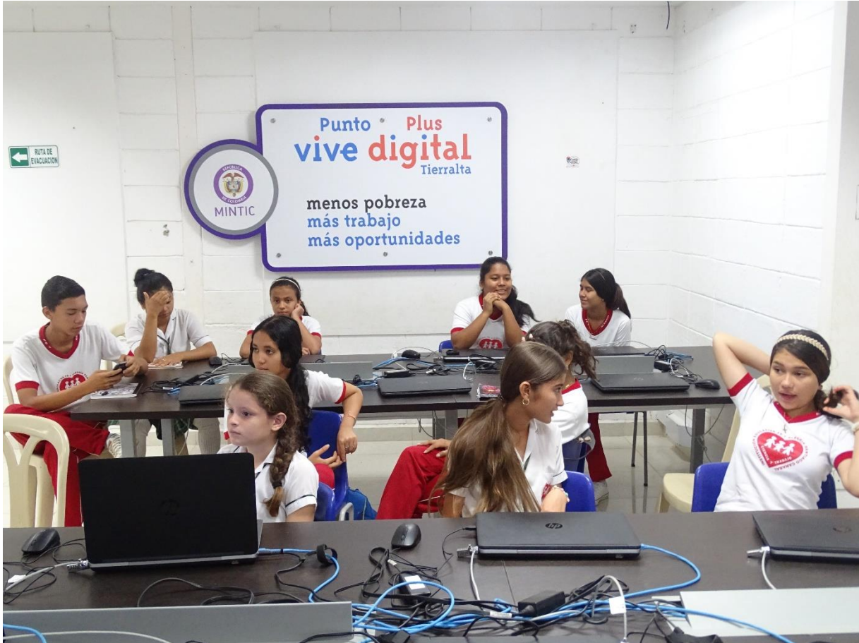
Punto Vive Digital Plus- Curso SENA Sistemas