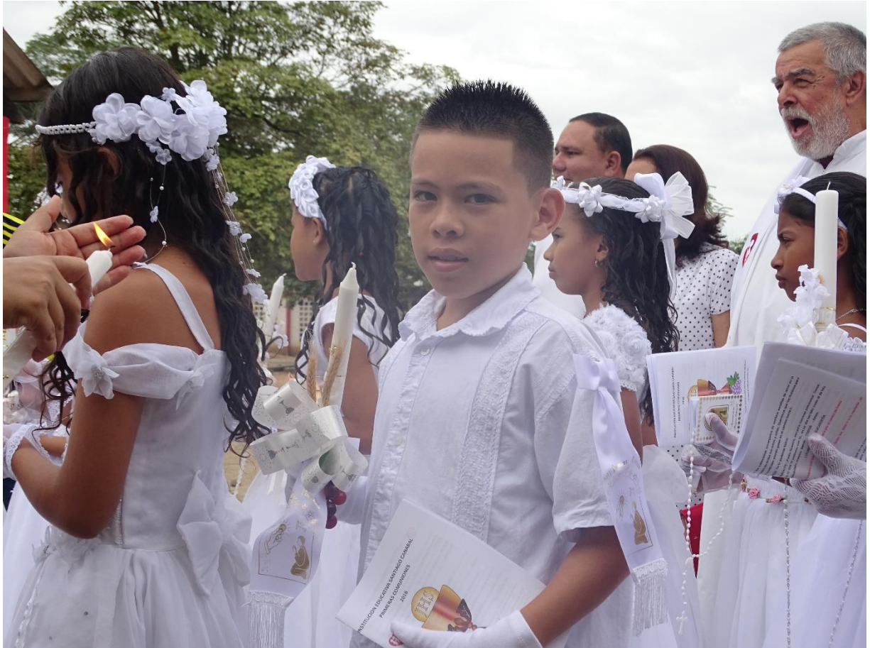
Pastoral social – Primeras comuniones