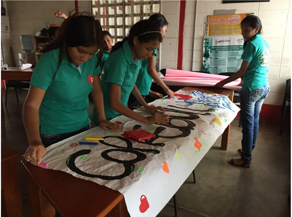
Proyecto de convivencia ciudadana