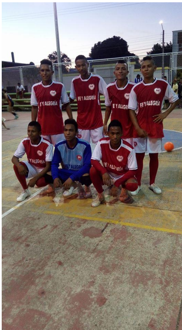
Participación Estudiantes juegos Supérate