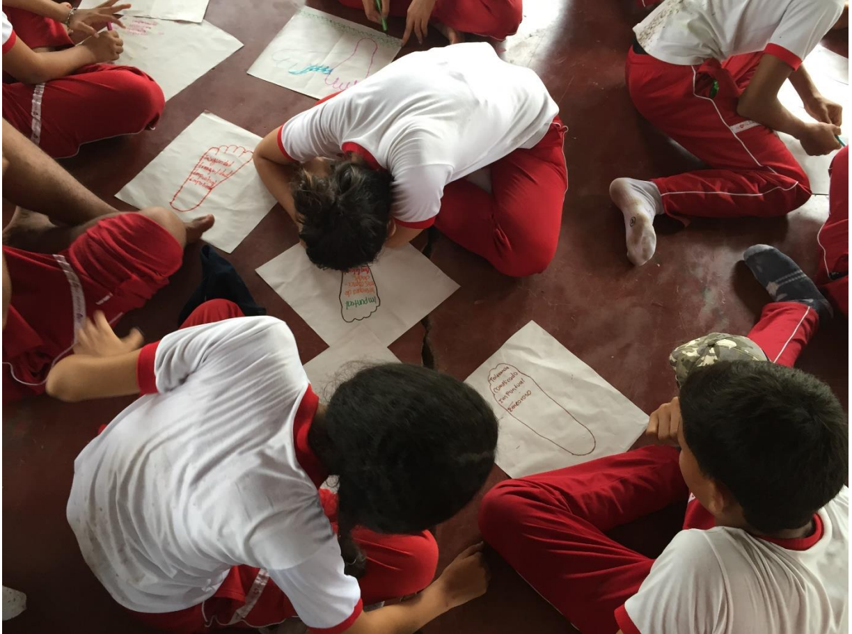
Convivencia motivacional 2016

DANE: 323807001802 Código ICFES: 060525 NIT: 812007020-5