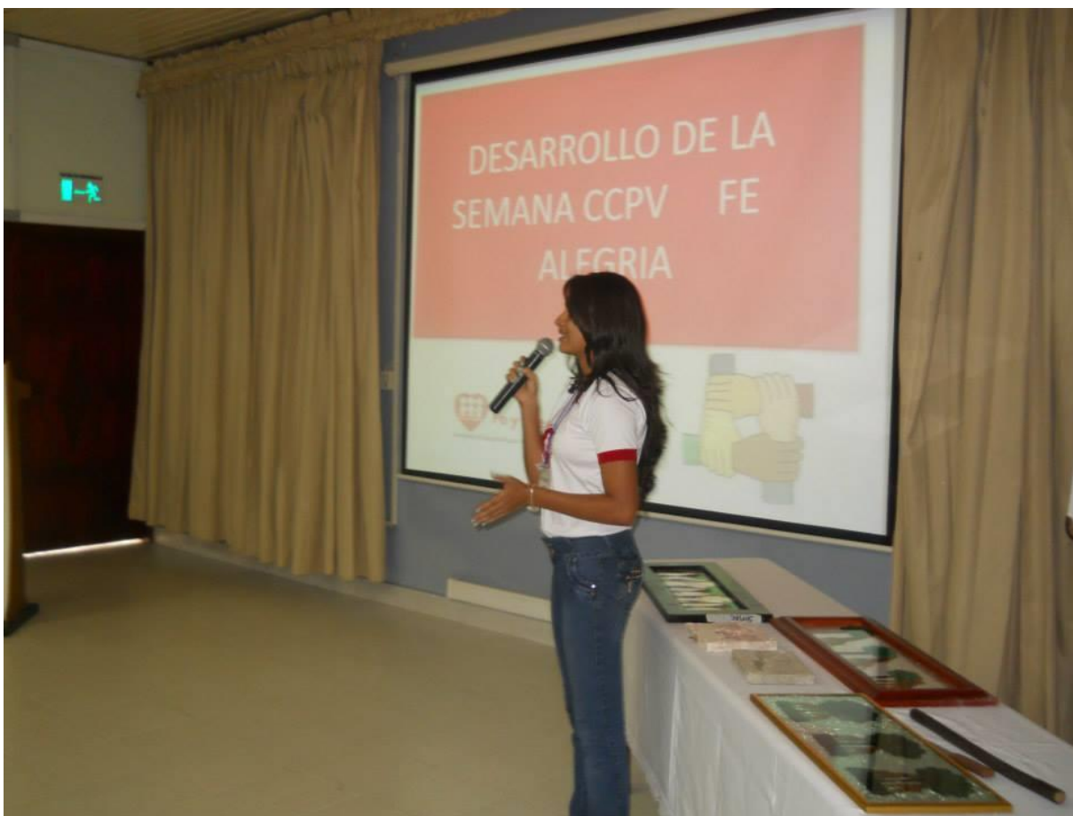
Semana CCPV 2016