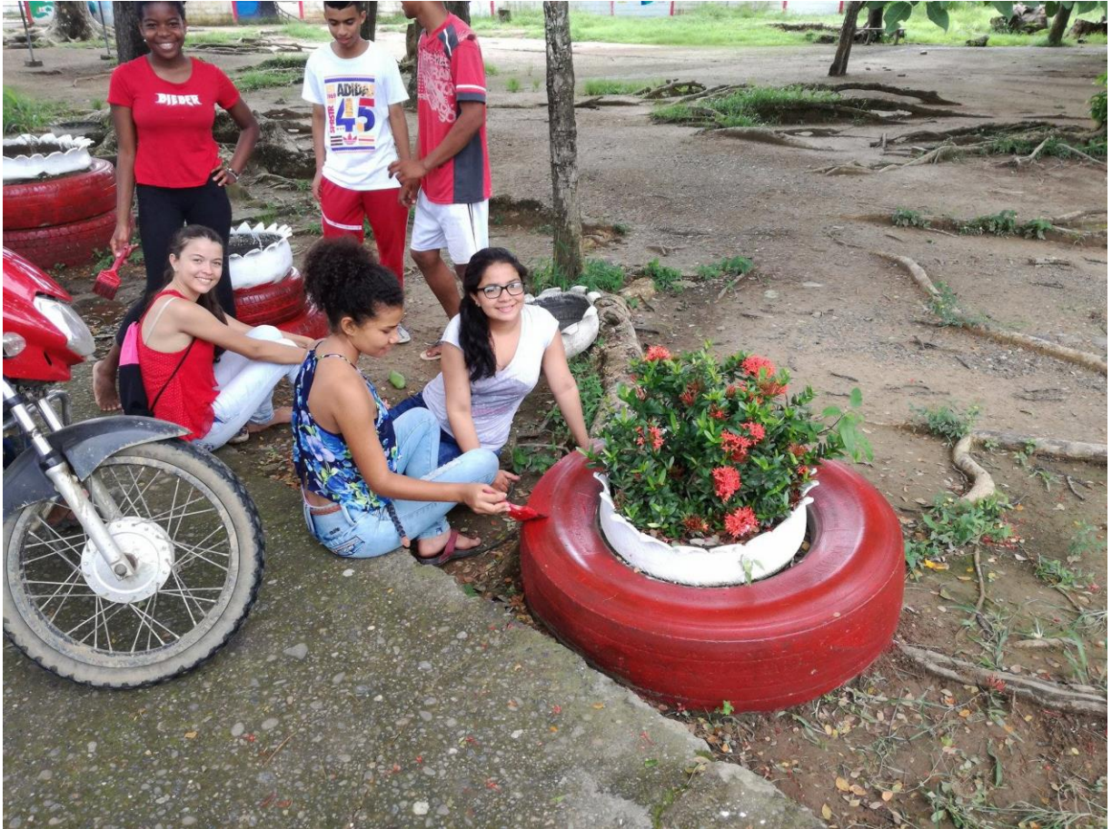
Ormamentación proyecto ambiental