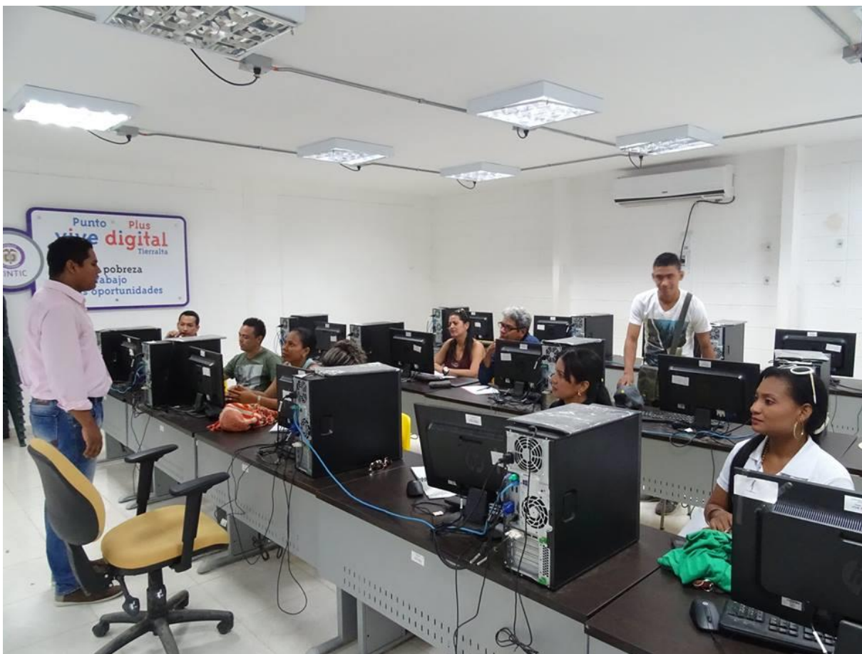
Taller ciudadano digital con padres