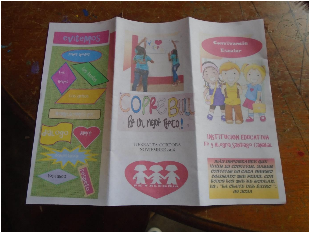
Proyecto Convivencia Ciudadana