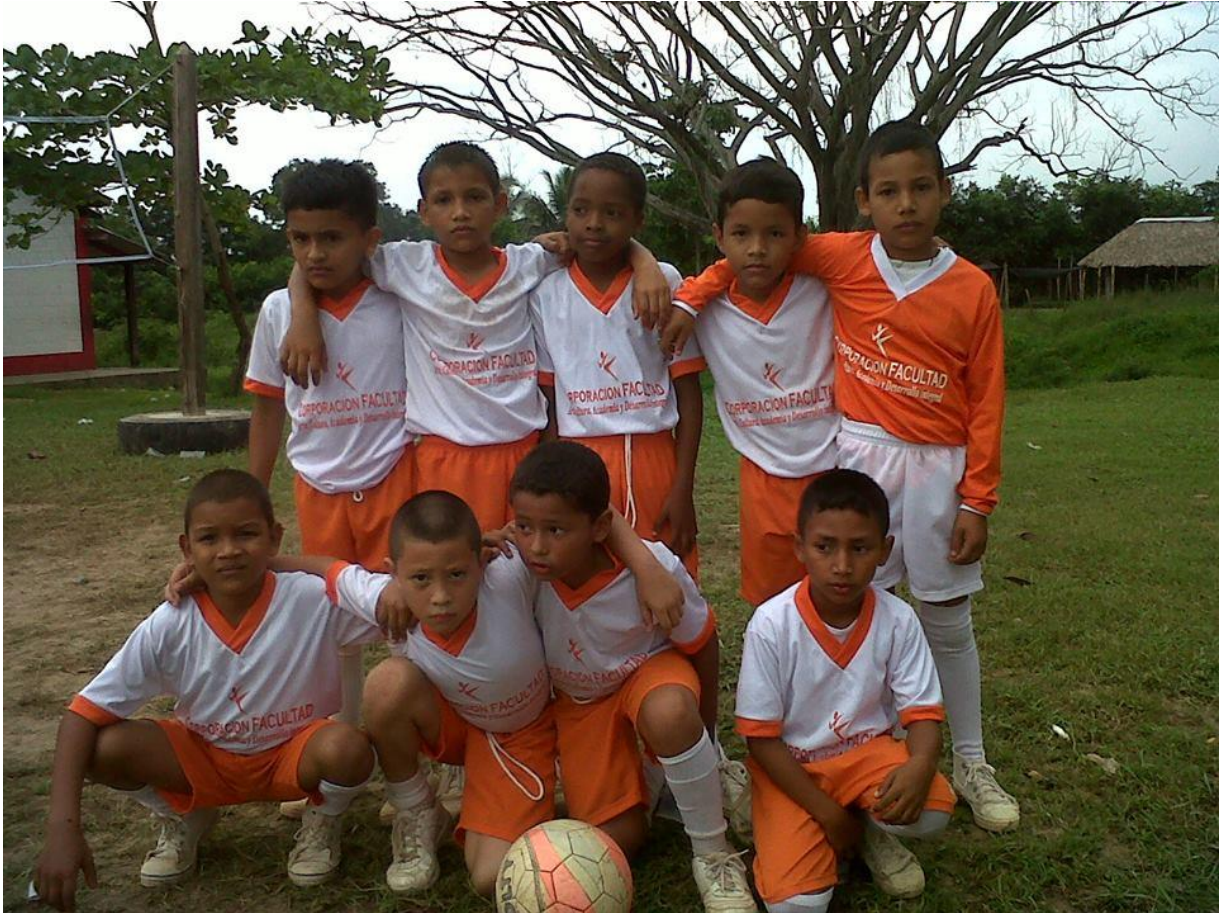
Campeonato intercurso 2016