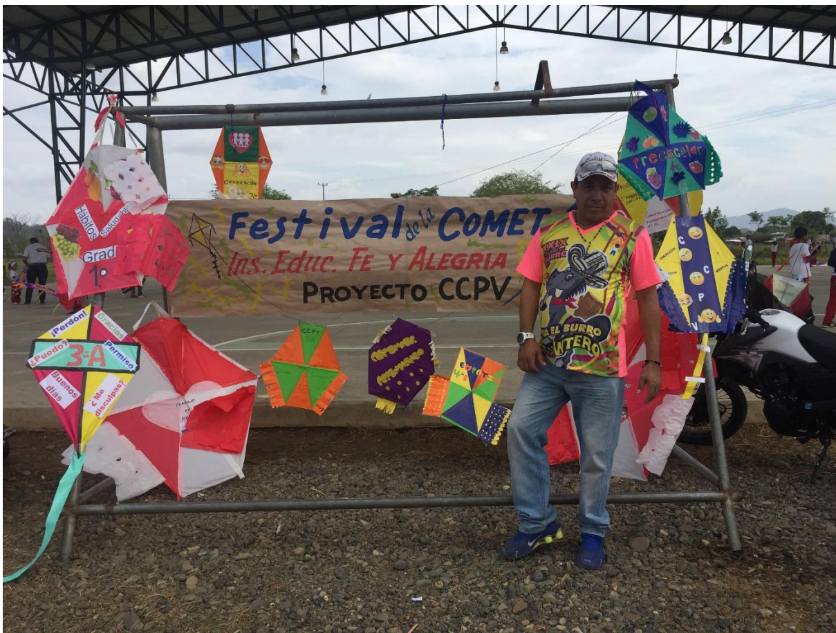
Festival de la cometa 2016