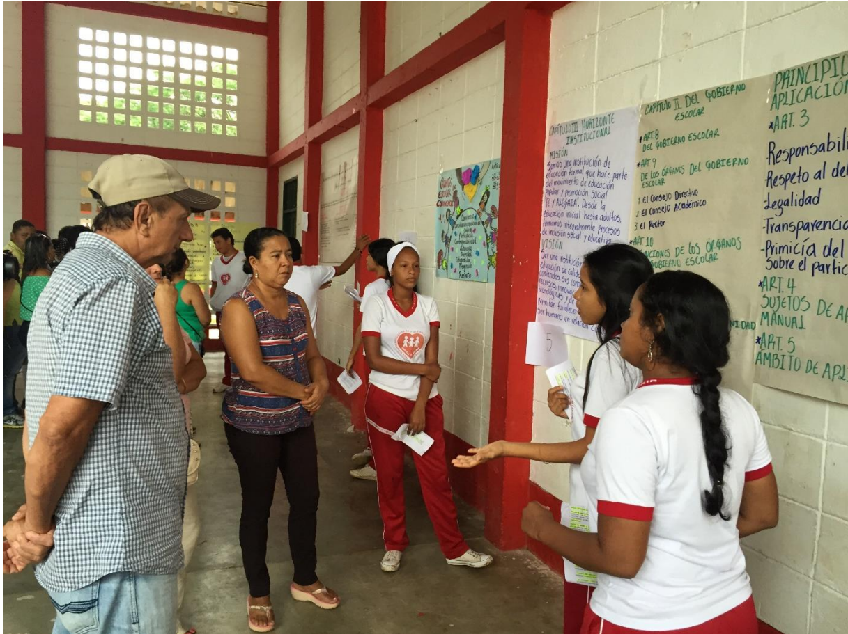
Taller con Padres 2016