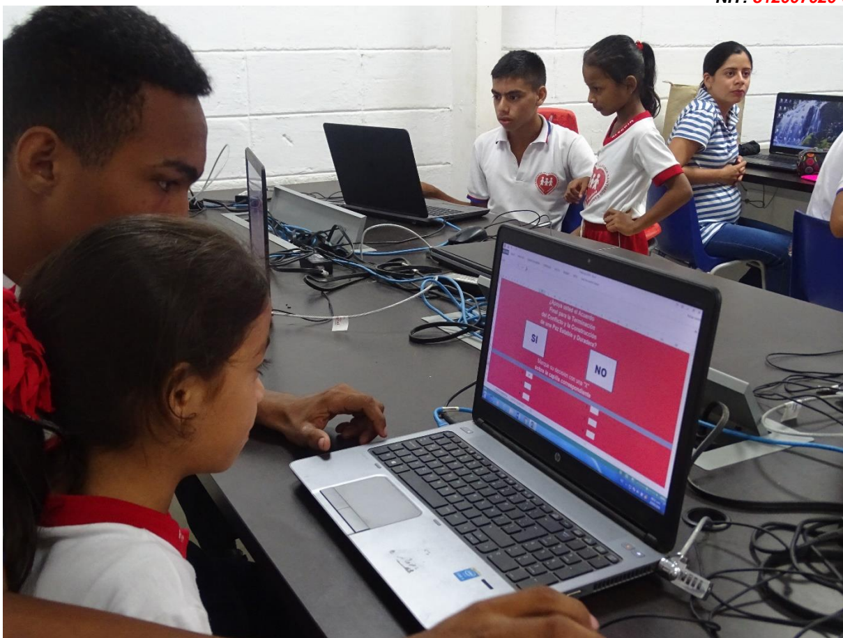
Plebiscito Escolar 2016- Proyecto de ciudadanía