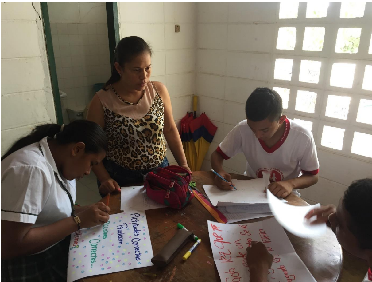
Motivación a Estudiantes 2016