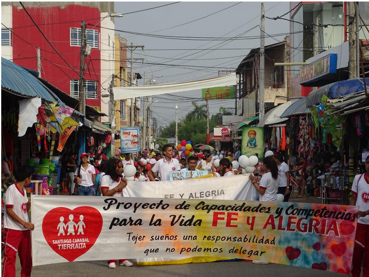
Lanzamiento Proyecto CCPV