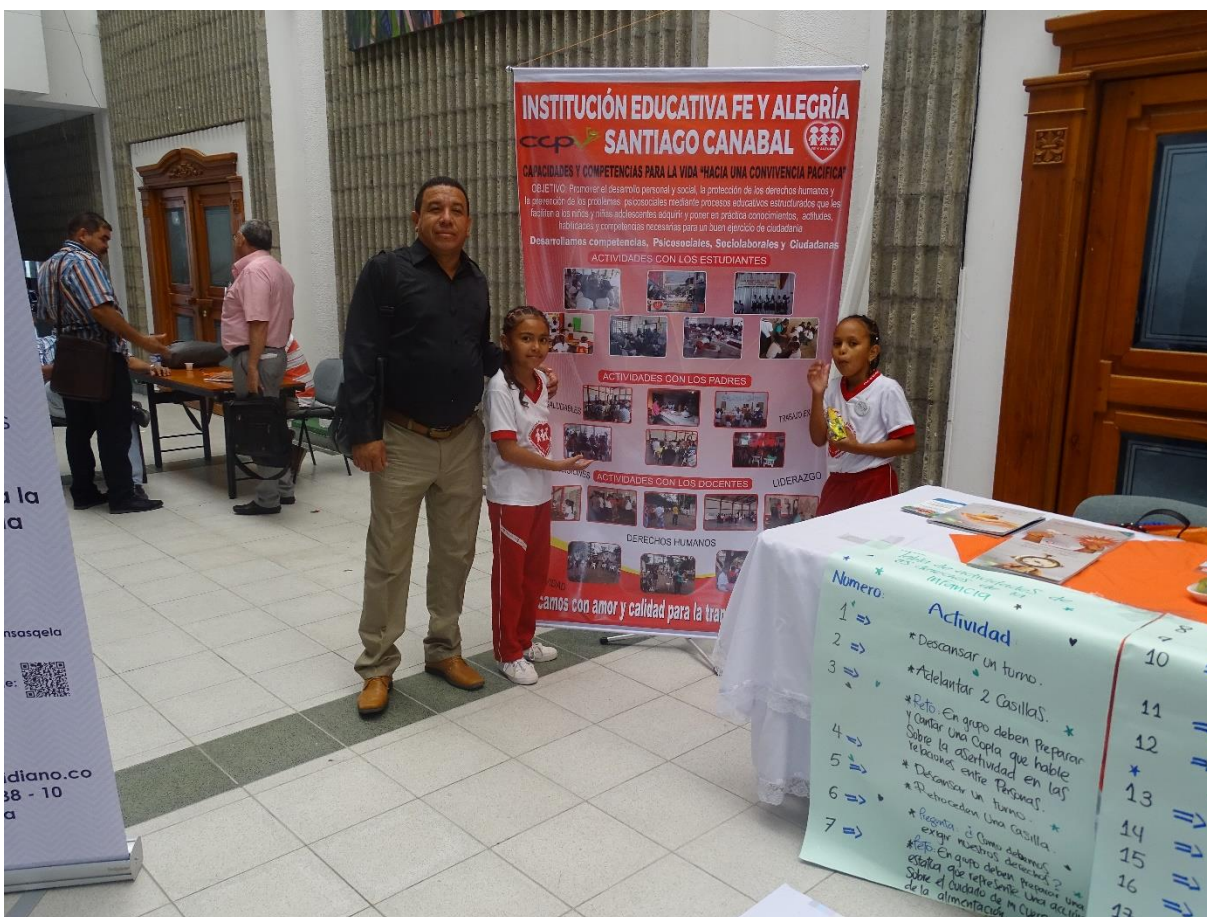
Foro Educativo Departamental

DANE: 323807001802 Código ICFES: 060525 NIT: 812007020-5