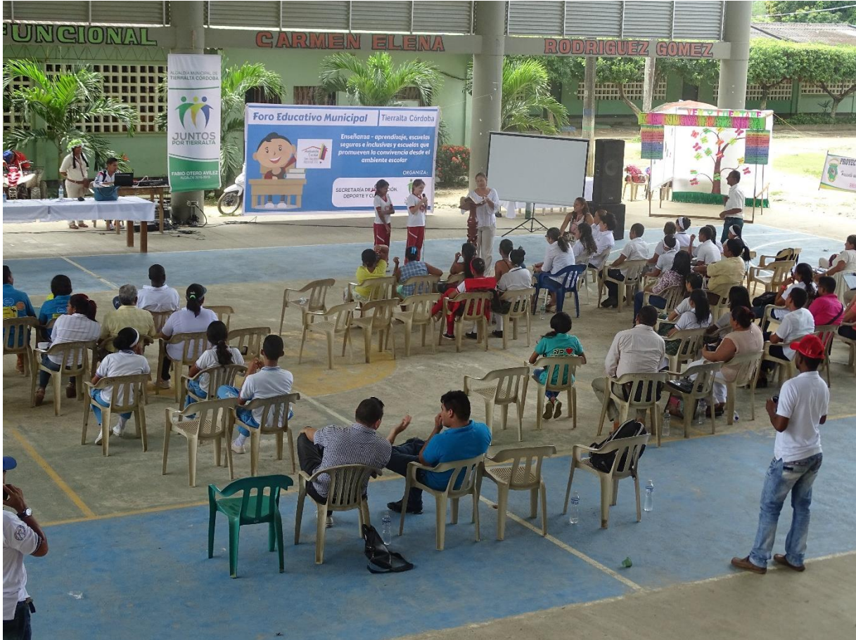
Foro Educativo Municipal

DANE: 323807001802 Código ICFES: 060525 NIT: 812007020-5