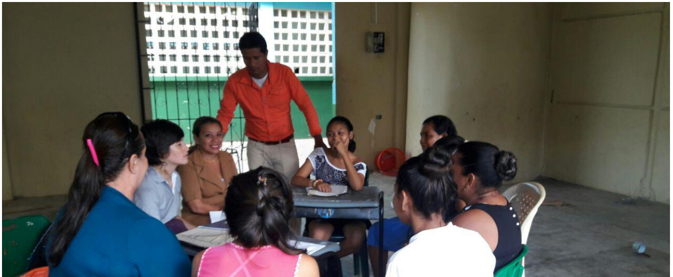
Participación en proyectos de investigación